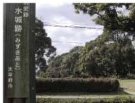
受験の神様・菅原道真を奉った

天智3年(664年)、唐と新羅の攻撃に備えて築かれた防衛施設。すべて人の手で築かれた人工の土塁(土の堤防)があります。