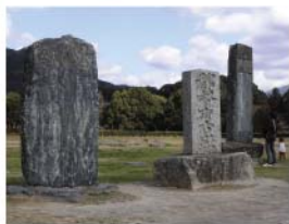
創建当時の七重塔の心礎が残る

約1300年前、天智天皇が九州の政治の中心として創建。都府楼跡という名で親しまれ、国の特別史跡地に指定されています。