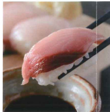
握り寿司 (媛スマ・鯛・サーモン・ハマチ・エビ)