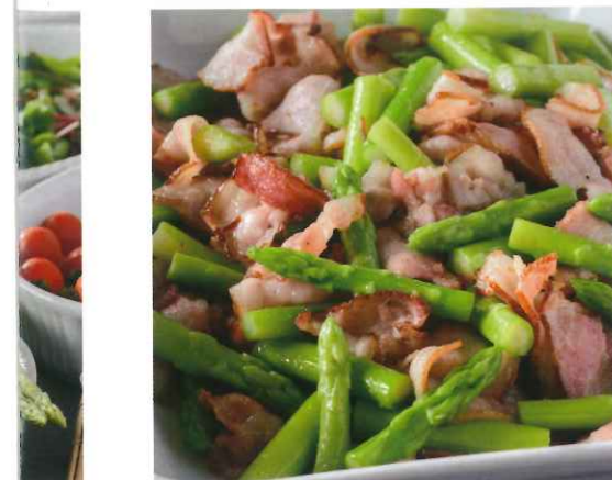
アスパラとベーコンの炒め物