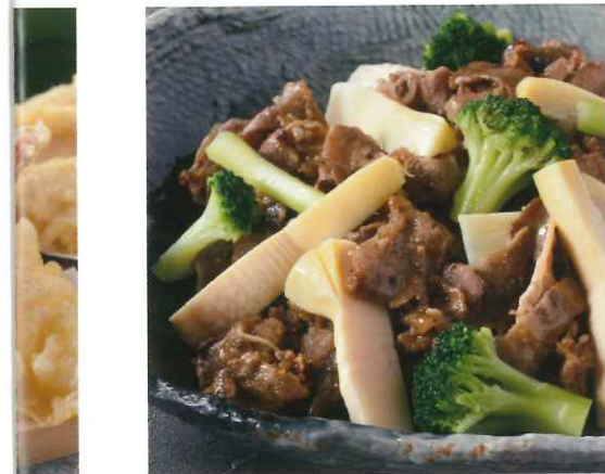
筍と牛肉の炒め物