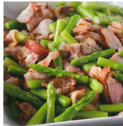
アスパラとベーコンの炒め物