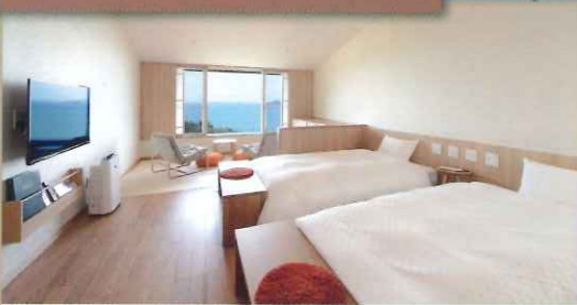
最上階 和洋室(1~4名様)