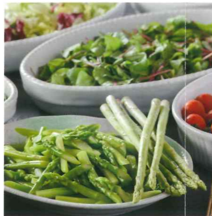
アスパラ他、地元野菜のサラダ