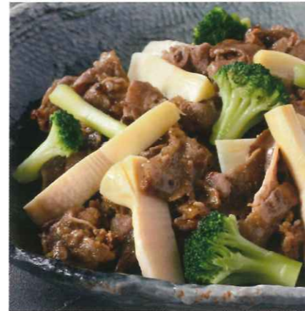
筍と牛肉の炒め物