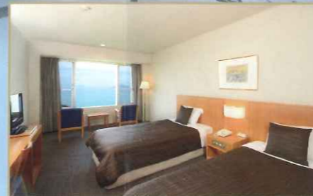
ツイン 洋室トイレ付(1~3名様)