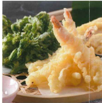
揚げたての天ぷら