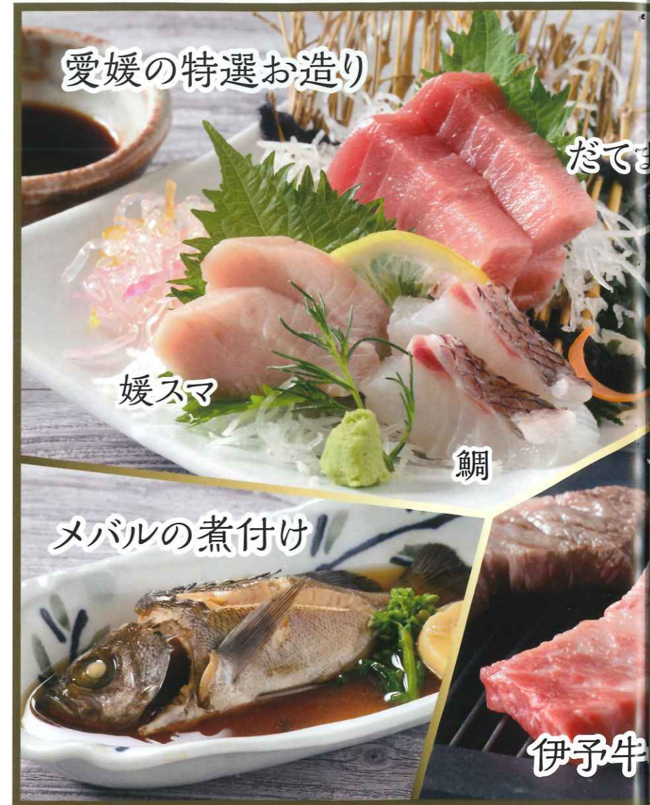
愛媛の特選お造り