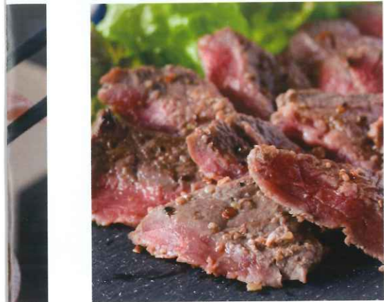
エビ 牛肉鉄板焼き