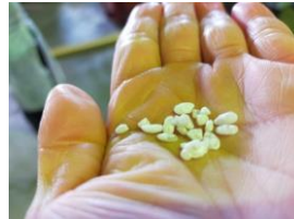
お酒造りの途中工程の麹菌がついた蒸した酒米を頂きました。甘い麹菌でした