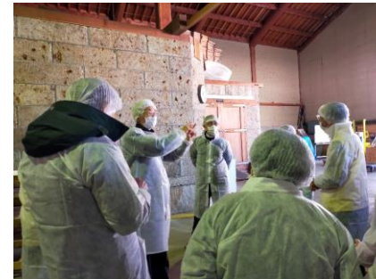
酒屋さんにとって麹とは、あかちゃんのように手厚く愛情持って、麹菌を基本に温度・時間・手間をかけるんだと話して下さいました。休憩時間も麹菌主導です。