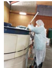
大きな樽に水・酒米・麹菌などを醗酵されているものを美味しくな〜れと願い混ぜさせて頂きました。生きた麹菌などがボロボロと泡をたて醗酵されている様子を見ながら、混ぜるたびにさわやかな香りが漂って来ました。みんなニコニコしています。