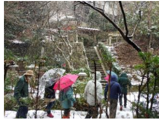
雪が降ると危険な石階段と鉄階段を皆さんで声掛けしながら登った先にお堂があります。ここに祀られて石仏がメインです。