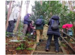
鹿小菩提寺からすぐの間魔様の石仏にも興味深々です。