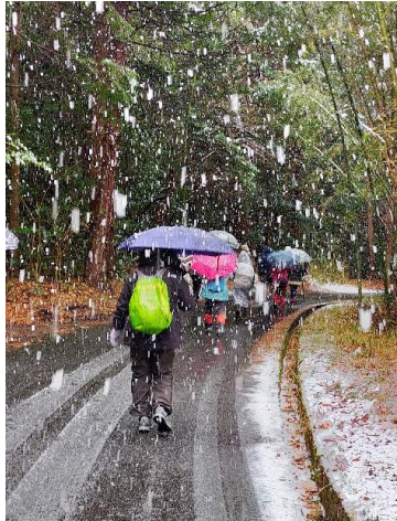
「岩根不動明王」バス降りて徒歩5分