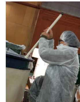
こっそり、味見で試飲させていただきました。しゅわしゅわお米がまだ口の中のにこるぐらいのまろやかさも感じ、レアな体験に大喜びでした。