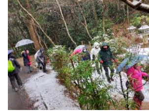
滑らないように慎重に