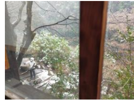
お堂からみた風景です。登山靴を履いてるお客様は脱ぐことをためられる方が多いので、今回はお堂には上らず。下から覗くこともできます。