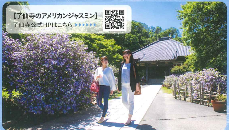
【了仙寺のアメリカンジャスミン】 了仙寺公式HPはこちら