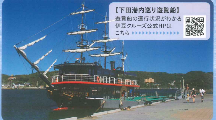
【下田港内巡り遊覧船】 遊覧船の運行状況がわかる 伊豆クルーズ公式HPは こちら