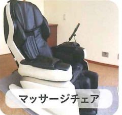
マッサージチェア