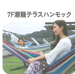
7F 潮騒テラスハンモック