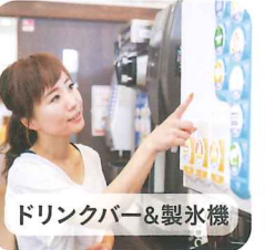
ドリンクバー&製氷機