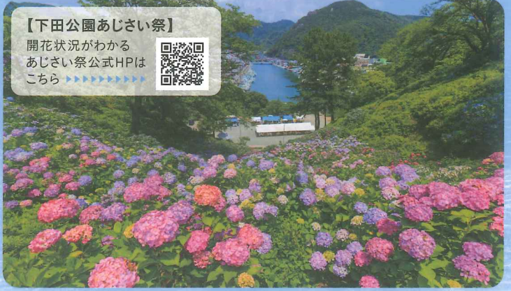
【下田公園あじさい祭】 開花状況がわかる あじさい祭公式HPは こちら