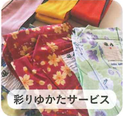
彩りゆかたサービス