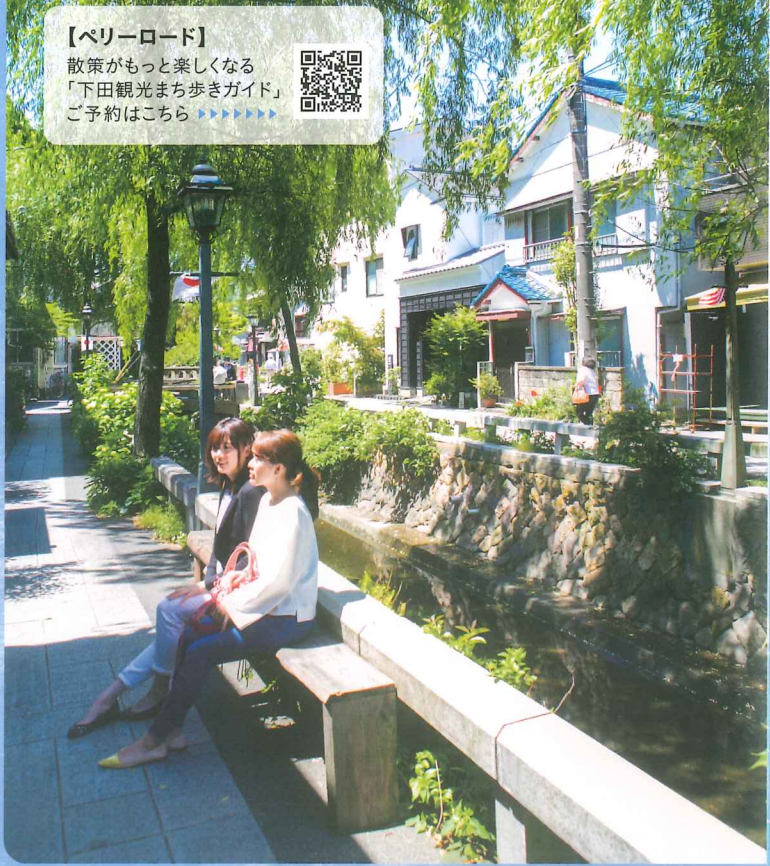
【ベリーロード】 散策がもっと楽しくなる 「下田観光まち歩きガイド」 ご予約はこちら