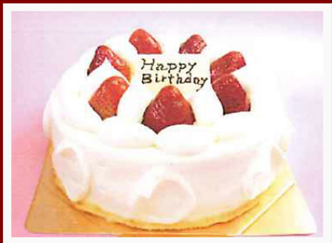
生クリームイチゴ

4号(12cm) 2人分 5,000円 5号(15cm)5,6人分 6,000円 6号(18cm)7,8人分 7,000円