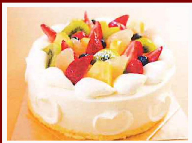
生クリームフルーツ

4号(12cm) 2人分 5,000円 5号(15cm)5,6人分 6,000円 6号(18cm)7,8人分 7,000円