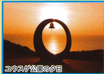
ユウスゲ公園の夕日