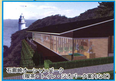
石廊崎オーシャンパーク (喫茶・トイレ・ジオパーク案内など)