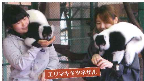
エリマキキツネザル