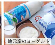
地元産のヨーグルト