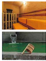
サウナも営業中 季節の薬湯