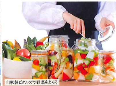
自家製ビュッフェで野菜をとりよう