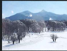
雪景色に癒される