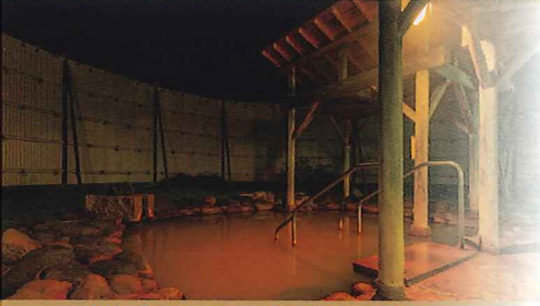
秋は「ぼかぼか」湯治がおすすめ。