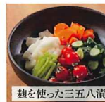
麹を使った三五八漬け