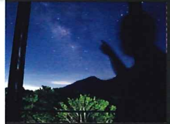
月のない晴れた日は部屋からも星が見えるかも!