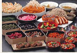
サクサク わかさぎ天ぷら

「こづゆ」や「にしんの山椒漬 け」「花豆」などの郷土料理 や「ソースカツ」「グリーンカ レ」「田楽」などローカル フードを楽しめるビュッフェで す。もちろん、天ぷらや刺 身、ソフトクリームなど様々 な料理もご用意!!