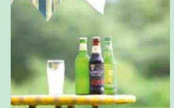
テラスでぶしゅっと夕暮れビアガーデン (300円~)