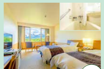
バス付きで便利な洋室ツイン 最大4名様まで