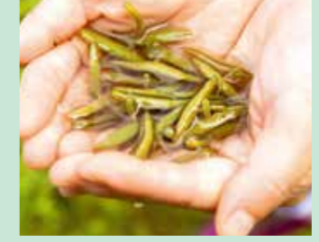
じゅんさい摘み体験 (6月中旬~8月中旬)