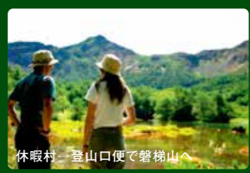
休暇村-登山口便で磐梯山へ