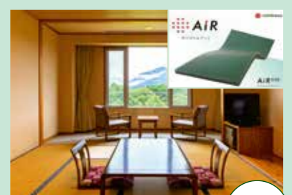
布団は西川のAIRで快適 ゆったり10畳の和室