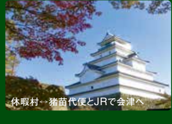
休暇村-猪苗代便とJRで会津へ