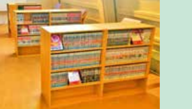
1,000冊のまんがラウンジ 読みたかったタイトルがあるかも