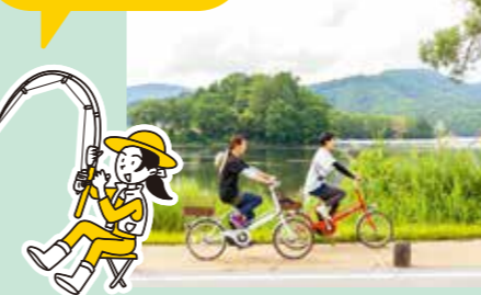
レンタサイクル 人気のパン屋さんや釣り堀まで