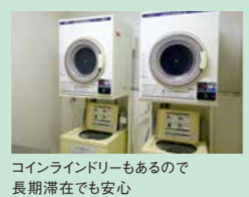
コインランドリーもあるので 長期滞在でも安心