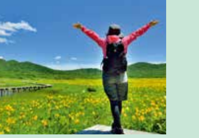
面積あたりのニッコウキスゲの株数 日本一 雄国沼(おぐにぬま)