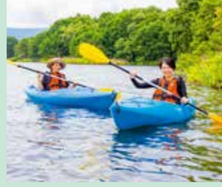
湖でカヌー体験 湖でカヌー体験