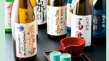
地酒も取り揃えています。滞在なら 次の日を気にせずゆっくり飲めますね