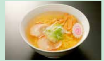
山塩ラーメンやソースカツ丼などの ランチメニューも別途ご用意