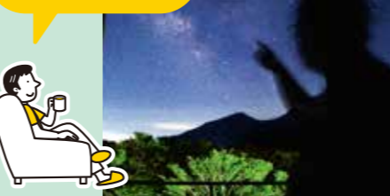
部屋の窓から見える星 室内からゆったり鑑賞