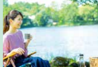
徒歩5分の湖のほとりでゆったり チェアリング※チェアの貸し出しあり