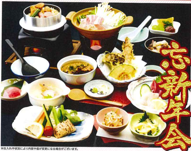
※仕入れや状況により内容や器が変更になる場合がございます。