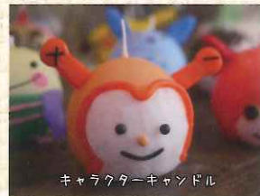
キャラクターキャンドル