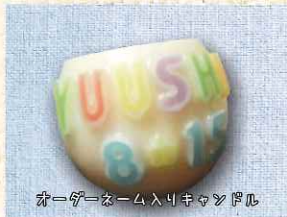
カラーゲーム入りキャンドル