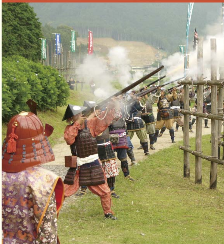
設楽原決戦場まつりの様子

天竜奥三河国定公園 休暇村 茶臼山高原 TEL.0536-87-2334 愛知県北設楽郡豊根村