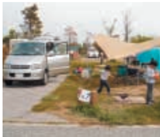
オートキャンプサイト

瀬戸大橋が一望できる標高400mの五色台の景勝地でキャンプを楽しむことができます。隣接しているビジターセンターでは、五色台の自然や環境問題について学ぶことができます（要予約）。 ■開設期間／3月下旬～11月下旬