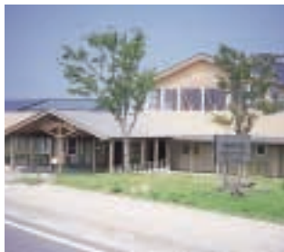
ビジターセンター ※月曜日、年末年始休館。