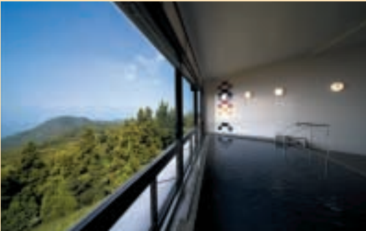
備長炭入り 展望大浴場

瀬戸大橋のすべてを一望できる随一の絶景浴場。湯船につかると、窓越しの眼下に瀬戸大橋をはじめ、瀬戸内の多島美を眺めることができます。四季折々の夕日と夜景も見事。また、お風呂は備長炭風呂で、お湯の分子を小さく変化させる効果があるため、肌にやさしいやわらかいお湯になっています。