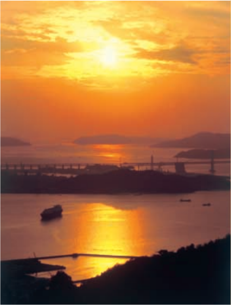
自然と人。人と人をつなぐリゾートホテル National Park Resort 休暇村

四国の瀬戸内海沿岸、高松から坂出寄りの海に飛び出た五色台は風光明媚な高台。休暇村はその中央部に位置し、瀬戸大橋や周辺の島々を一望する本館と、テニスコート、芝生広場、プールなどが、赤松と広葉樹の緑に抱かれて点在しています。周辺は四国八十八カ所霊場巡りの地として歴史を刻んできました。