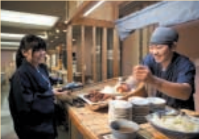
和食創作バイキング

瀬戸の夕日を望む展望レストランでは和食創作バイキングが彩り豊かに約60種類並びます。厳選された海の幸の逸品料理もおすすめ。食後のデザートも充実しており、お子様から大人までお楽しみいただけます。