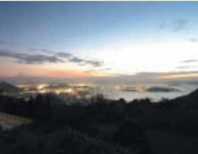
休暇村より見た坂出・丸亀方面の夜景

客室数66室(和室62室、洋室4室)、宿泊定員246人、大浴場、レストラン、ラウンジ、売店、大広間、会議室